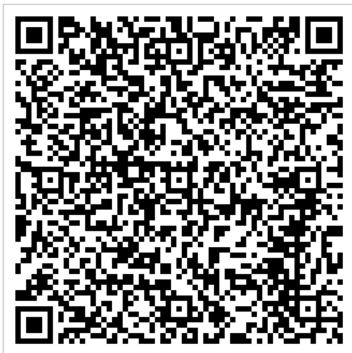
QR-Code Immobilien Lichtenberg

Vermietbare Fläche: 0,00 m 2 Kaufpreis: 1.200.000,00 EUR x-fache Miete: 10,00