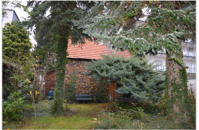
Scheune - Abriss